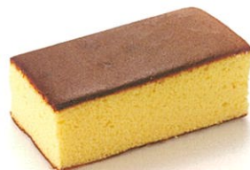
長崎カステラ ● 箱入り(大) ● 箱入り(小) ● 切り売り