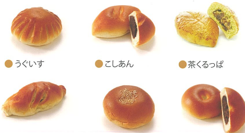
● うぐいす ● こしあん ● 茶くるっぱ ● 白あん ● つぶあん

あん類 餡(あん)の種類も豊富で、和菓子屋時代からの 自家製餡がたっぷり入っています。