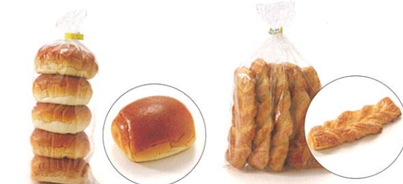
● ロールパン ● パイデニッシュ