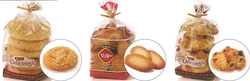
● ピーナッツクッキー ● ラングドシャー ● ロッククッキー