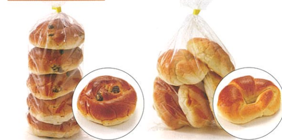
● 丸ぶどうパン ● バターロール