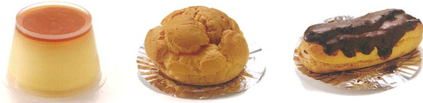
● プリン ● カスターシュー ● エクレア