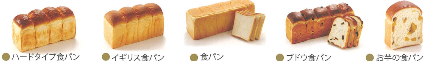
● ハードタイプ食パン ● イギリス食パン ● 食パン ● ブドウ食パン ● お芋の食パン

スキラッチ 生地を幾層にも重ね、それぞれの味を (土日祝 抹茶タイプあり) マーブル模様混ぜ焼き上げました。