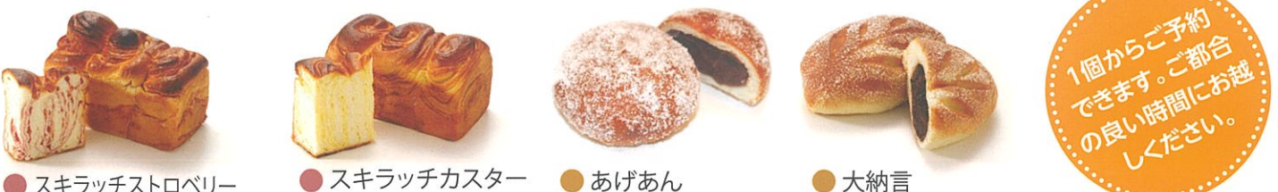
● スキラッチストロベリー ● スキラッチカスター ● あげあん ● 大納言