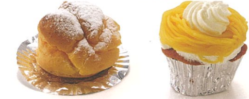
● 生シュークリーム ● モンブラン

お茶菓子だけではなく、ご進物にもご用意できます。 和菓子を感じさせる「おまんじゅう」などもあります。 不定期商品の「ラスク」が列んでいたら、 とっても運がいいかも知れません。