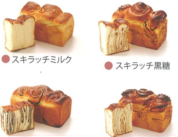
● スキラッチミルク ● スキラッチ黒糖 ● スキラッチチョコラ ● スキラッチモカ (現在製造をお休みしています。) ● スキラッチカスター

スキラッチ 生地を幾層にも重ね、それぞれの味を (土日祝 抹茶タイプあり) マーブル模様混ぜ焼き上げました。