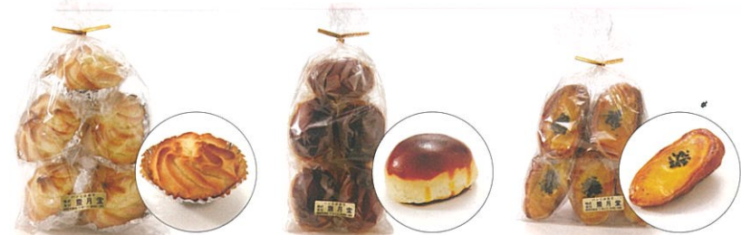
● パラシグレ ● 栗饅頭 ● イモパン