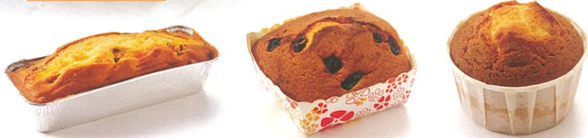
● パウンドケーキ ● レーズンマフィン ● マフィン