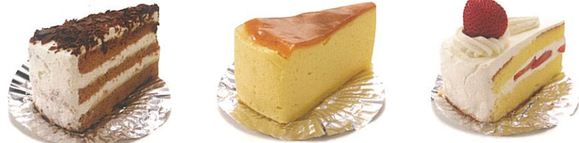
● チョコレートケーキ ● チーズケーキ ● ショートケーキ